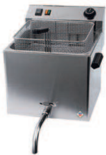
FE - 10 T

Masivní koš je vyroben z chromované oceli s izolovaným držadlem a závěsným úchytem. Všechny modely jsou vybaveny pracovním a pojistným termostatem, síťovým vypínačem a dvojitou kontrolkou indikující zapnutí a vyhřátí lázně. Při delší odstavce je možné lázeň přiklopit nerezovým víkem.