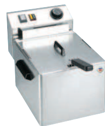
FE - 07