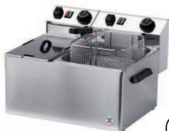
FE - 74