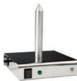
HD - 1

Pro splnění všech kapacitních požadavků je vhodné využívat kombinace jednotlivých modelů.