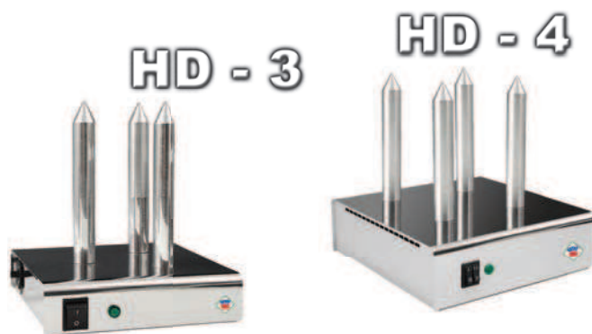
HD - 3

W celu zapewnienia odpowiedniej wydajności zalecane jest stosowanie kombinacji różnych modeli.