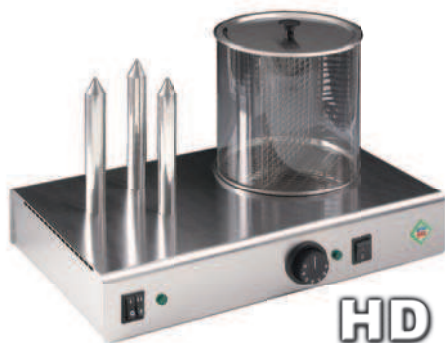
HD - 3N