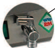
Výpustný kohout Zawór spustowy