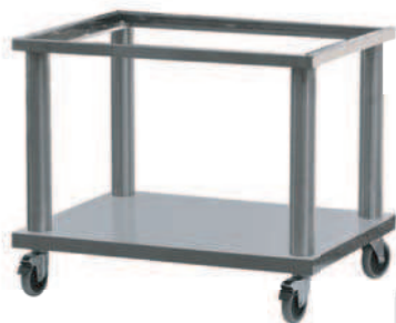
PO - 80 M