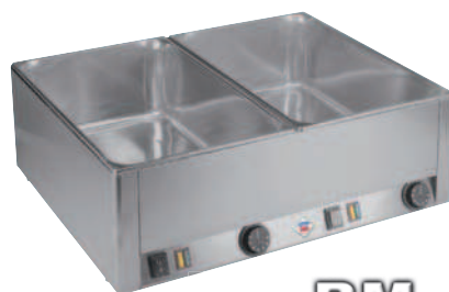
BM - 2115

Všechny nabízené vodní lázně lze postavit na stůl. Dále jsou pro jednotlivé modely nabízeny podestavby s regulovatelnými nožičkami, nebo jsou osazeny kolečky. Řešení s pojízdnou podestavbou velmi zvyšuje mobilitu zařízení. Pro modely BM-1115, 2115 jsou nabízeny podestavby PO 30, 60 (30M, 60M) a pro BM-1120, 2120 podestavby PO 40, 80 (40M, 80M).