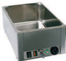
BMV - 1115