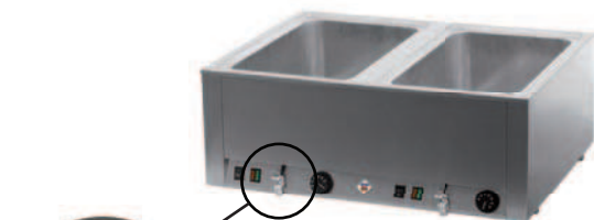
BMV - 2120

Do modeli BM-1115, 2115 są przeznaczone podstawy PO 30, 60 (30M, 60M), a do BM-1120, 2120 podstawy PO 40, 80 (40M, 80M).